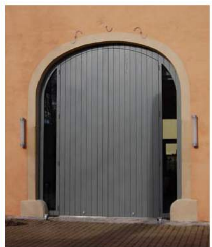
Localisation : Beckerich - LUXEMBOURG Atelier d'architecture BENG, Esch-sur-Alzette