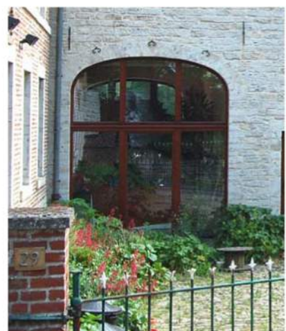
Localisation : Mélin - JODOIGNE

Le nom de l'auteur de projet a été renseigné lorsqu'il nous était connu