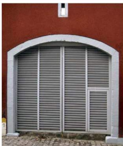
Localisation : Beckerich - LUXEMBOURG Atelier d'architecture BENG, Esch-sur-Alzette