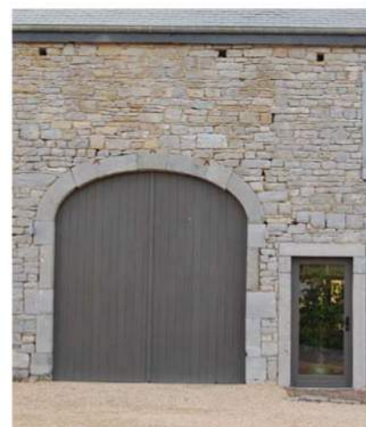
Localisation : Oppagne - DURBUY