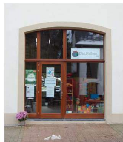
Localisation : Nothomb - ATTERT Atelier d'architecture arlonais A3 sprl, Arlon