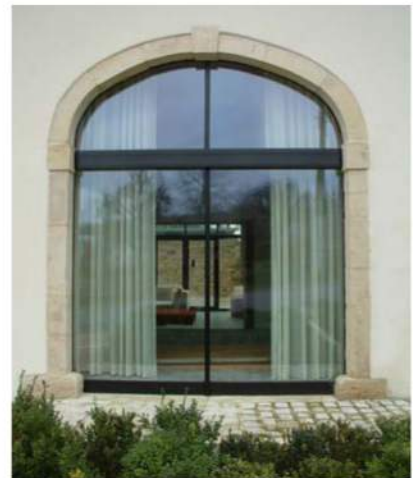
Localisation : Bonnert - ARLON Architectes Urbanistes Valentiny & Associés, Liège