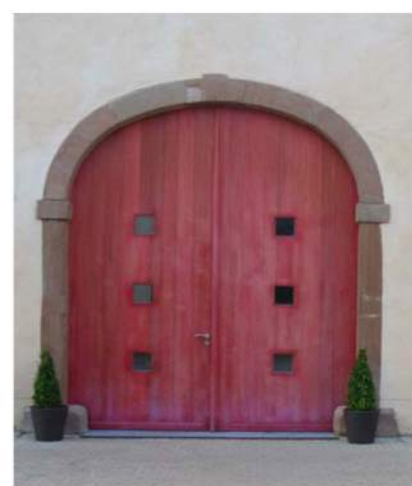
Localisation : Attert - ATTERT ALINEA TER srl - B. Giaux, ir. architecte, Habay-la-Vieille

Il est possible de remplacer ou de restaurer une porte de grange en respectant les caractéristiques patrimoniales du bâtiment tout en utilisant des techniques et des matériaux contemporains. En voici l'illustration au travers de quelques exemples glanés par-ci, par-là. Ces projets illustrent de diverses façons les trois grands principes à respecter pour ce type de réalisation : la conservation de l'encadrement, la préservation de la simplicité du panneau et la prise en compte de la géométrie de l'arc.