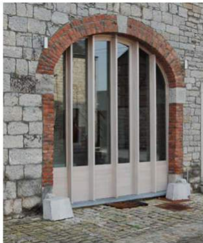
Localisation : Ny - HOTTON L.Tihange, architecte, Marche-en-Famenne